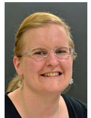
Werder Sarah Ch