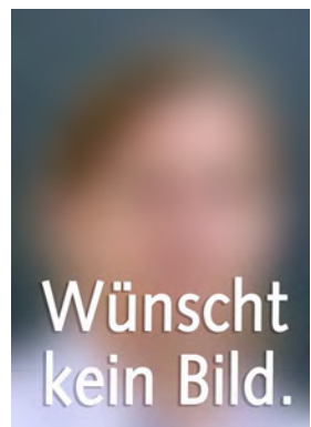
Roten Vincent Sport, F, Gg, MINT