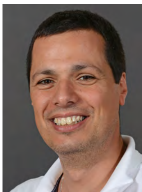
Cassata Natale F, I