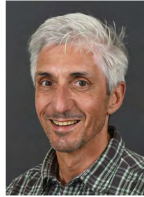
Meyer Urs Inf, MINT