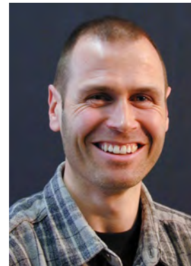
Borer Paul Sport, Gg, WR