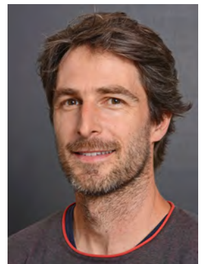
Holliger Tobias Sport, Ph