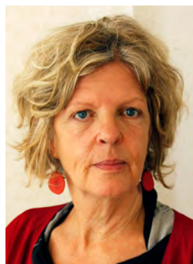
Roth Claudia BG