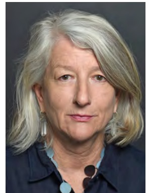
Borer Renata BG, KG