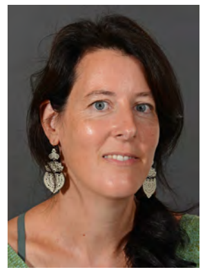
Linz Tanja Bi, Ch, MINT