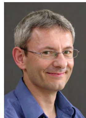
Humair Marcel Konrektor Gs, Gg