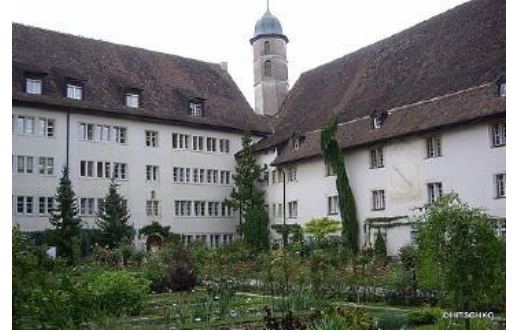
Lycée cantonal de Porrentruy

Das einzigartige Bildungsangebot der Kantone Baselland und Jura: