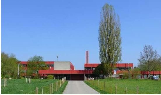
Regionales Gymnasium Laufental-Thierstein

Gymnasium Laufental-Thierstein, Steinackerweg 7, 4242 Laufen